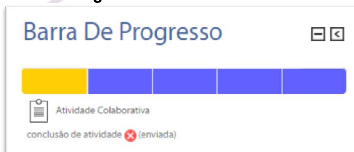
Figura 2 – Status em análise