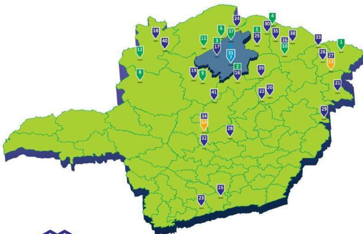
Figura 1: Mapa da área institucional de atuação da Unimontes